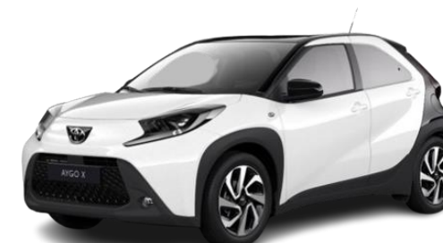
TOYOTA AYGO X 1.0 VVT-I 72 CV 5 PORTE TREND

RISPARMIO ASSOCIATO 360 € i.i. (295 € i.e.)