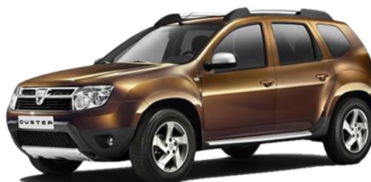
DACIA DUSTER 1.0 TCE GPL 4X2 EXPRESSION

RISPARMIO ASSOCIATO 420 € i.i. (344 € i.e.)