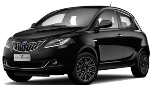
LANCIA YPSILON 1.0 FIREFLY 5 PORTE S&S HYBRID ORO

RISPARMIO ASSOCIATO 300 € i.i. (246 € i.e.)