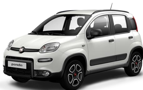
FIAT PANDA 1.0 FIREFLY S&S HYBRID