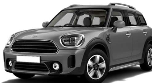
MINI COUNTRYMAN 1.5 COOPER CLASSIC