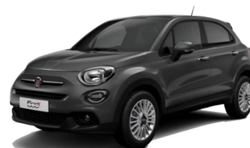
FIAT 500X 1.3 MULTIJET 95 CV